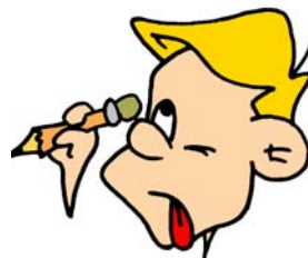
Análisis y reflexión