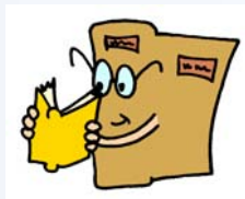
Aportes teóricos diversos